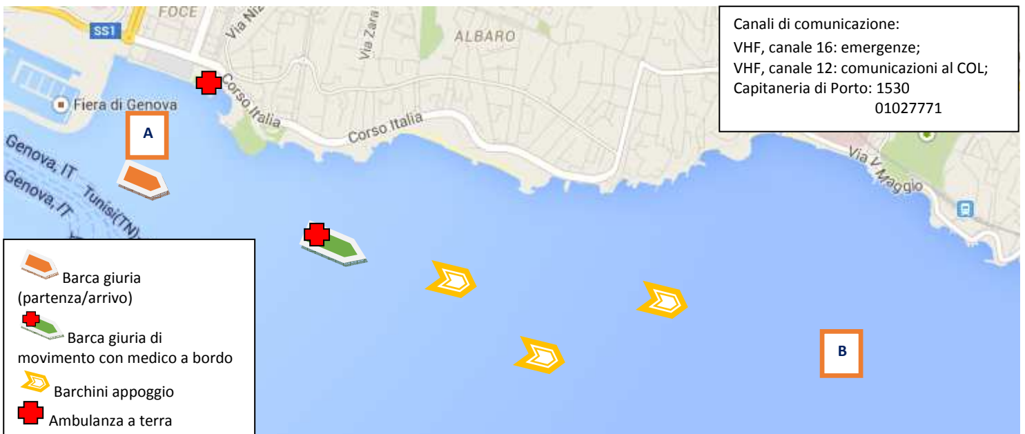
Figura 4. Indicazioni sulla sicurezza in mare.