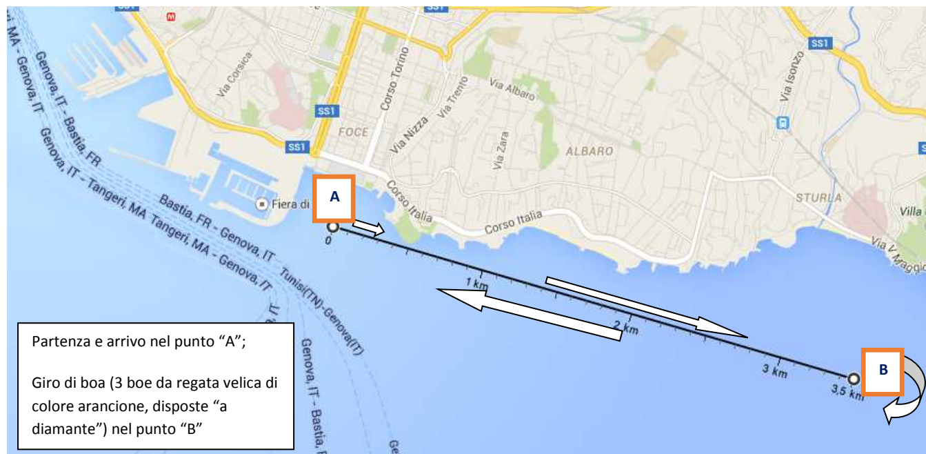
Figura 1. Il percorso di gara