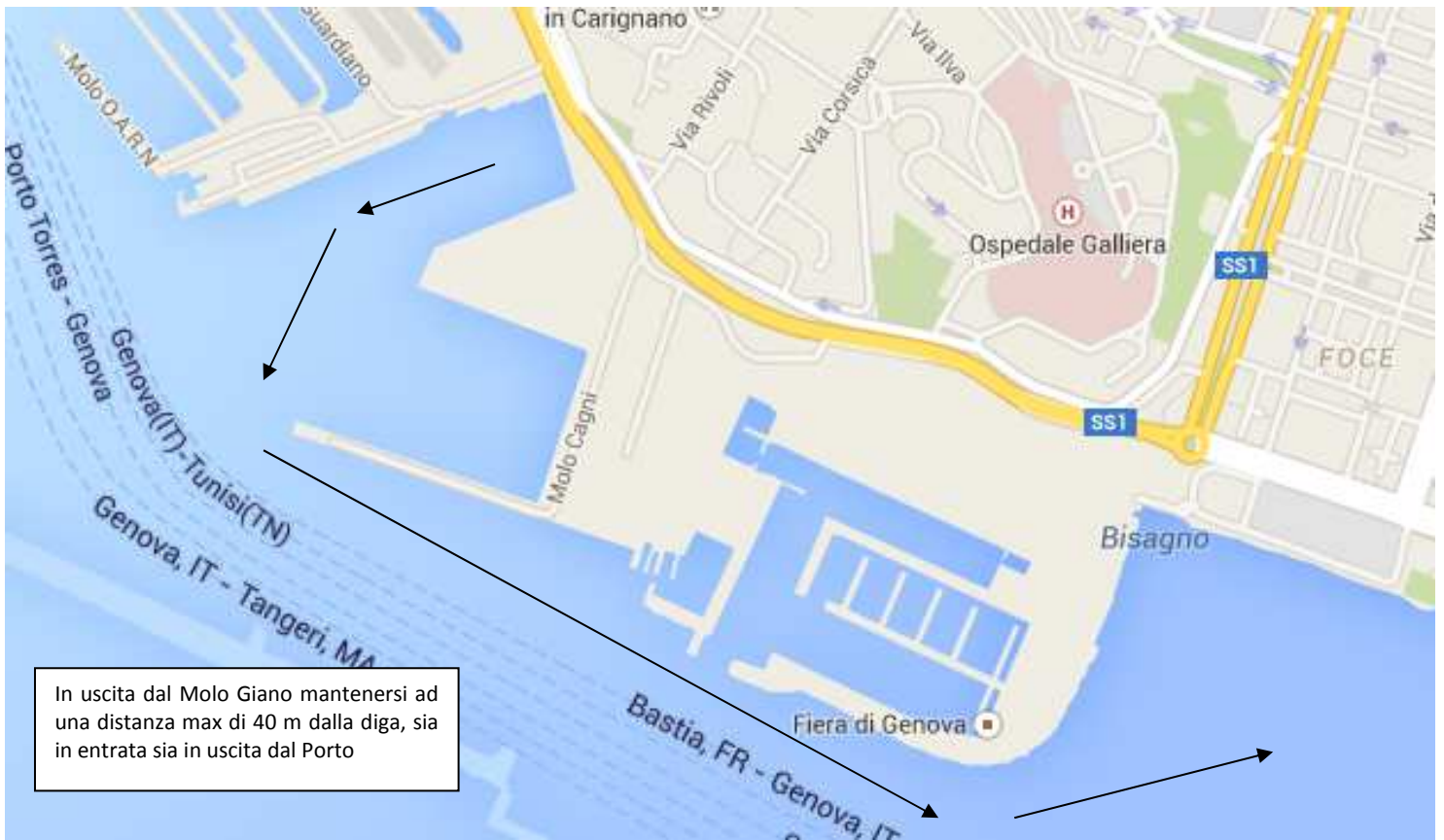
Figura 3. Istruzioni per l'ingresso e l'uscita dal porto.